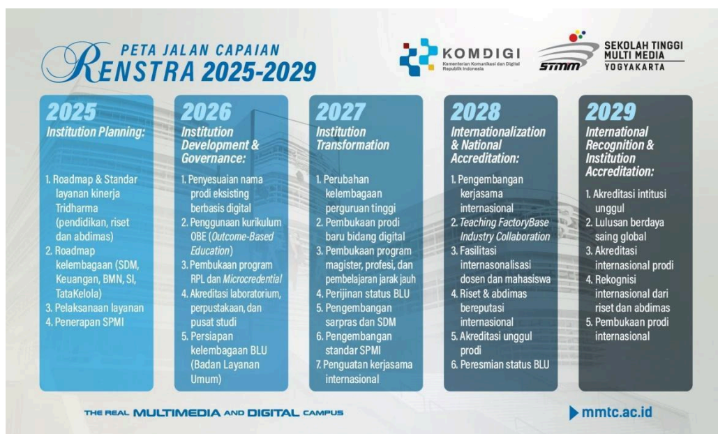
Gambar 2.1 Roadmap STMM Tahun 2025-2029

Rencana Strategis STMM merupakan penjabaran serta tindak lanjut dari Renstra Badan Pengembangan Sumber Daya Manusia Komdigi. Guna mempermudah pencapaian kinerja telah disusun Roadmap STMM tahun 2025 - 2029. Dalam roadmap ini telah ditetapkan hal-hal yang akan dicapai serta indikator yang perlu diselesaikan dalam kurun waktu 5 (lima) tahun kedepan guna mencapai Visi dan Misi yang telah ditetapkan.